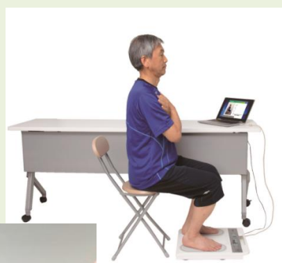
立ち上がりテスト